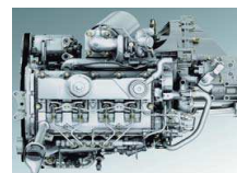
Motore 2.2 Duratorq TDCi Trasversale

Ford 350 TDCI pianalato 110 CV Ford 350 TDCI pianalato 140 CV